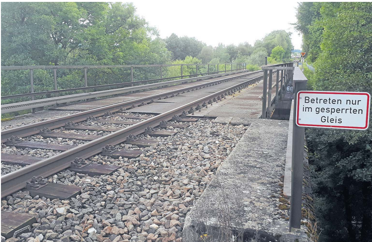
Noch in diesem Jahr soll eigentlich die marode, aber wohl noch sicher befahrbare Eisenbahnbrücke über die Eyach bei Schmiden ausgetauscht werden. Ob es dazu kommt, ist noch unklar.

Weitere beanstandete Zollernalbahnbrücken sind in Mössingen, dazu die beiden Bahn-