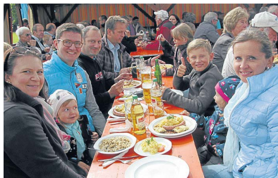
Ein spätsommerliches Treffen für viele Heselwanger war das gestrige Wasenfest des örtlichen Musikvereins.